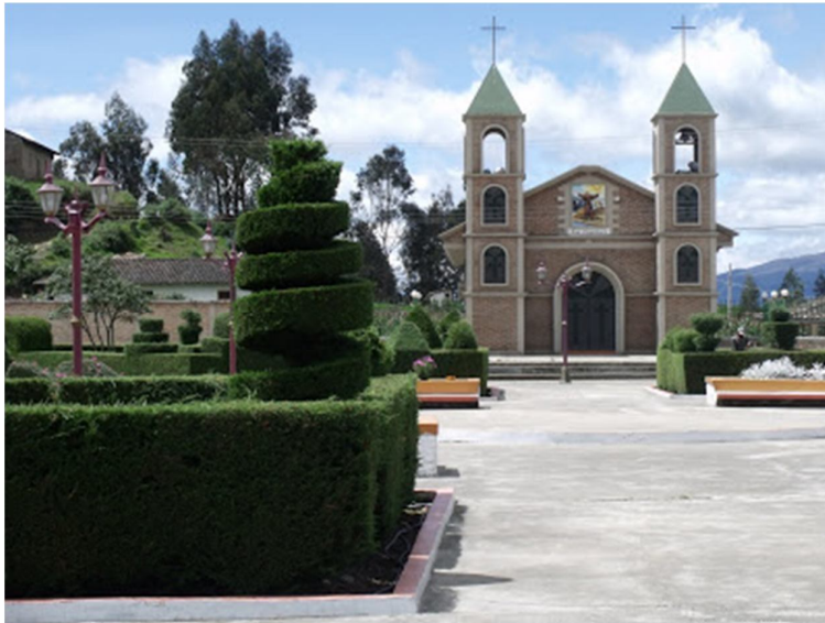
Parroquia Mariano Acosta (provincia de Imbabura)

Instituto de Ecología y Desarrollo de las Comunidades Andinas (IEDECA) Oxfam Intermón en Ecuador (OI) Generalitat Valenciana