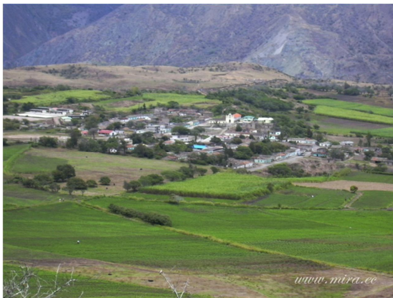
Parroquia La Concepción (provincia de Carchi)